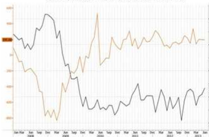
就業持續好轉將持續帶動消費信心